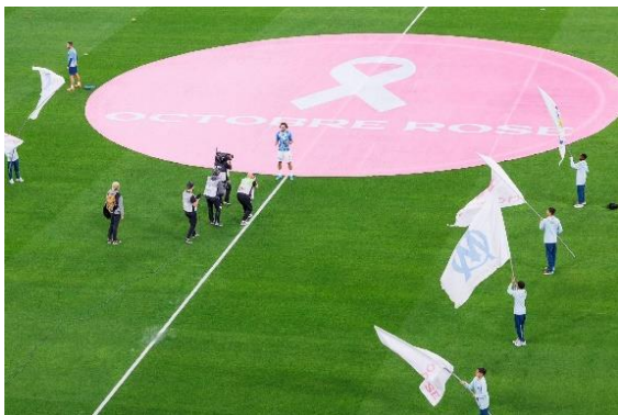
Match OM/Angers